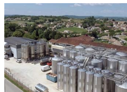
3ÈME BASSIN D'ÉVAPORATION pour Saint Maurice. Une mise à jour normative adaptée à notre bon fonctionnement.