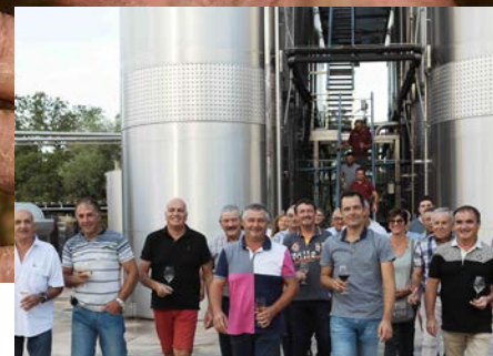
NOUVELLE DÉNOMINATION. Sur décision de l'Assemblée Générale, Cave Saint Maurice devient Saint Maurice, le Piémont des Cévennes.

Moins de papier, mais un accès sur le site www.cavestmaurice.com . Une plus grande souplesse d'utilisation mais également une grande facilité de partage et d'échange. Tout cela en gardant l'esprit de la lettre : des contenus, des news, des hommes et femmes et des images.