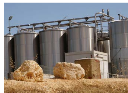
ÉQUIPEMENT DE BROUZET. Rénovation pour répondre au potentiel bio avec l'appui de l'ICV.